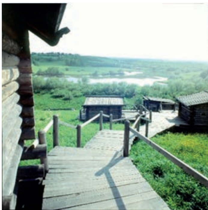
Иллюстрация 2 — Подпорная стенка в музее «Малые Корелы».