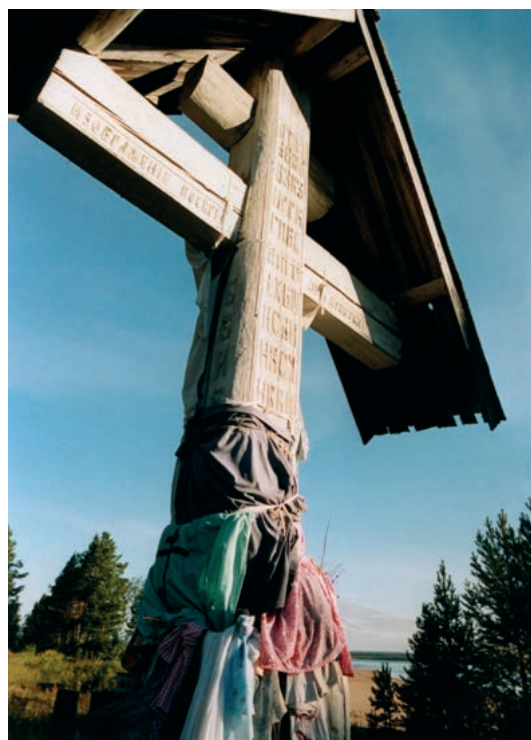
Иллюстрация 10 — Обетный крест в Заборе, Мезенский р., 1887.

Другое сакральное и особо почитаемое место находится в Заборе, на берегу р. Мезень в 1,5 км от с. Кимжа. Здесь в 1887 г. поставлен обетный крест купцом Савиным «в память о спасении от утопления в р. Мезени» . Это характерный для Русского Севера восьмиконечный крест, высота 4,55 м. Вертикальный основной брус пересекают три перекладины: две горизонтальные и одна наклонная. Основание креста выполнено из цельного толстого бревна, обтесанного с четырех сторон. На кресте резное распятие, вверху — медный литой крест и оклад для несохранившейся иконы. На центральной перекладине традиционные слова молитвы: «Кресту твоему поклоняемся, Владыко, и Святое Воскресение твое славим» . На обратной стороне большого перекрестия надпись: «Изображение Воскресения молитвы» . Поверхность креста покрыта криптограммами и словами молитвы. Вокруг особо почитаемого креста сделана ограда, две скамейки внутри нее. Свечи ставятся в металлический ящичек, защищенный от ветра закрывающейся створкой.