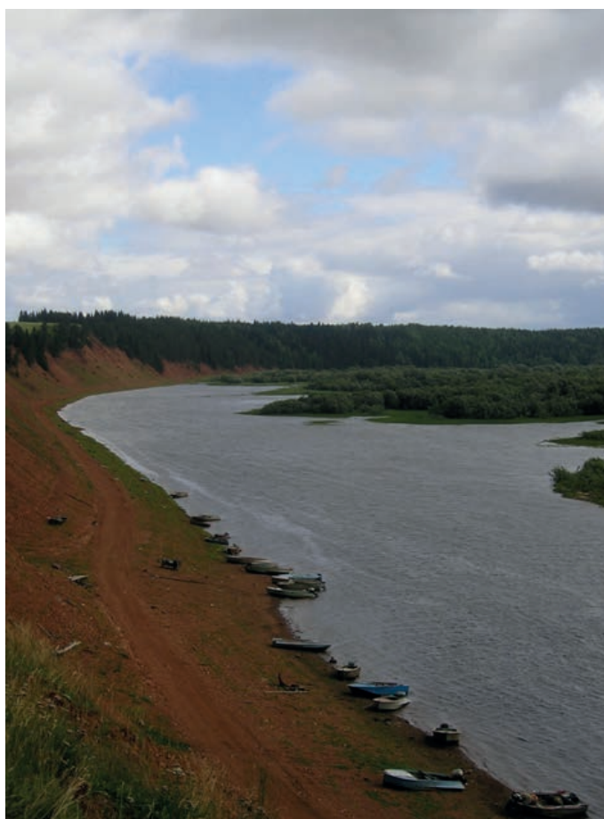
Иллюстрация 1 — Река Мезень. Figure 1 — Mezen River.

Эта территория определяется как Мезенско-Кулойский край. Она располагается в бассейнах двух рек — Мезени и Кулоя, а также побережья Мезенской губы. Река Кулой берет свое начало на Беломорско-Кулойском плато, впадая в Мезенскую губу Белого моря. Общая длина реки около 350 км. Обилие на Мезени леса, преимущественно состоявшего из ценных пород — лиственницы, сосны, ели, — позволяло местному населению возводить добротные жилые, хозяйственные и культовые постройки, часто весьма значительных размеров. Наиболее типична для мезенских поселений рядовая планировка. Дома ставили вдоль высокого берега реки с ориентацией на юг, юго-восток.