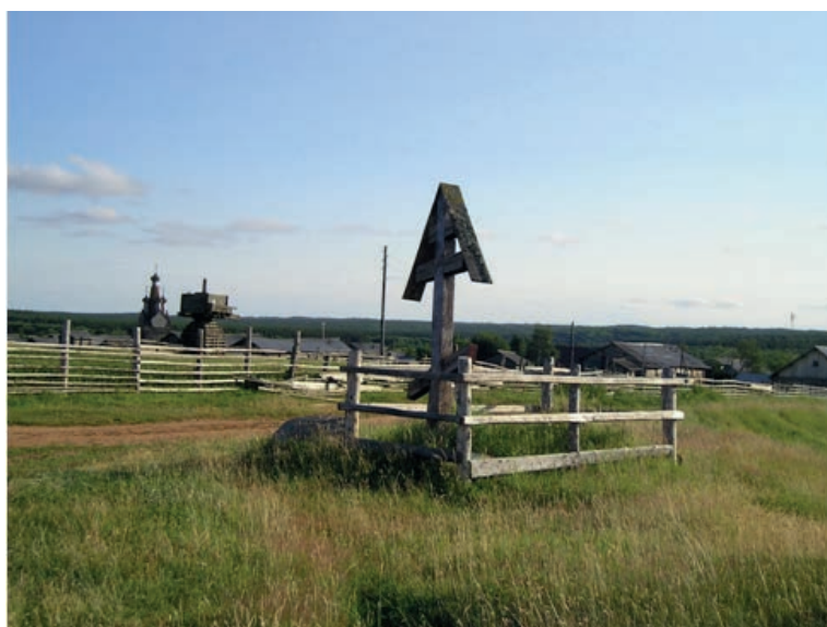
Иллюстрация 8 — Захоронение в поле на семейных угодьях, с. Кимжа Мезенский р., сер. XX в. Figure 8 — Burial in a Field on Family Lands