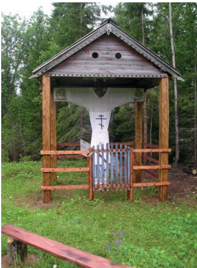
Иллюстрация 6 — Крест в лесу, спрятан от поругания в 1937 г., д. Березник, Лешуконский р. Figure 6 — Cross in the Forest, Hidden from Desecration in 1937, Bereznik vil., Leshukonsky District.

Крест из мезенской д. Семжа восьмиконечный, вырезанный из четырехгранных брусьев, в центре крест, копьё и трость, внизу — голова Адама. Здесь же в основании, креста дата изготовления «1877 года февраля 26 дня». Экспозиция музея под открытым небом дает возможность моделировать культурный ландшафт и располагать памятники народного зодчества, в том числе обетные кресты, в природном естественном окружении. Мезенская деревня в музее под открытым небом является удачным примером реконструкции культурного ландшафта мезенских сельских исторических поселений, которые в естественной среде расположены по высоким берегам р. Мезень. В Мезенском секторе музея на высоком берегу р. Корелка установлен обетный крест (копия) из д. Козьмогородская Мезенского района [16, с. 116–124] 1 .