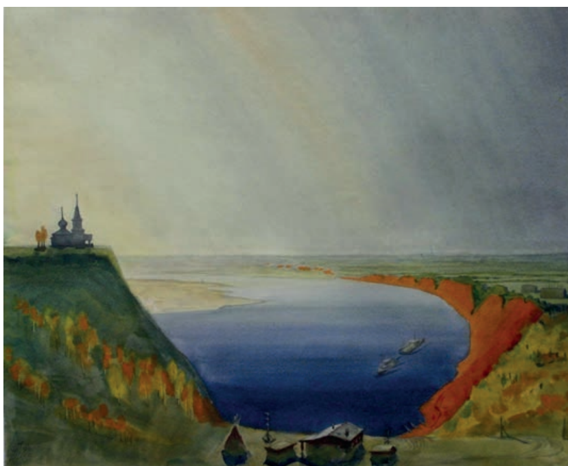
Иллюстрация 3 — П. Лешуков. Троицкая церковь, д. Нисогоры, Лешуконский р., 1996 Figure 3— P. Leshukov. Trinity Church, Nisogory vil., Leshukonsky District, 1996

очень хорошо чувствуется архитектурный ансамбль деревни. Отдельные сооружения гармонично связаны между собой и подчинены друг другу. Здесь все продумано: от выбора местоположения и размеров изб до постановки симметрично расположенных против каждого дома хозяйственных построек — амбаров и бань; от километровой рубленой подпорной стенки до хорошо организованного центрального спуска к реке; от постановки на самом высоком месте в селе («на гриве») деревянной церкви или часовни до декоративного решения коньков, крылец, столбов [3, с. 11].