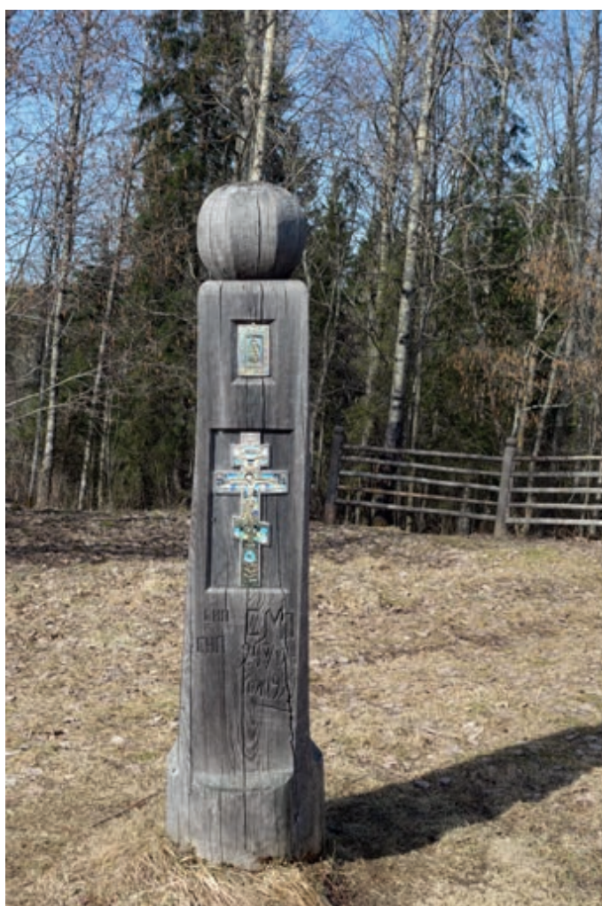
Иллюстрация 5 — Столб основания д. Березник, Лешуконский р., 1879.

В других случаях вместо креста ставили столб основания деревни, но с обязательной иконой и небольшим литым крестом на его лицевой стороне. Этот знак поселения зафиксирован в мезенских деревнях. Например, столб основания д. Березник Лешуконского района (1879), в настоящее время памятник музея деревянного зодчества «Малые Корелы». Столб высотой 1,7 м, вырезан из лиственницы. На лицевой стороне икона и небольшой литой медный крест. На поверхности столба вырезана надпись: «сия деревня основана в 1879 г. ФАС» (Федором Антиповичем Ситниковым). На боковой грани более поздняя надпись: «СИП, СПП, СМП 24/VI — 1941 рожд. 1922». Предположительно, трое братьев или близких родственников 1922 г. р. ушли на фронт во время Великой отечественной войны 24 июня 1941 г. [8, с. 16–17].