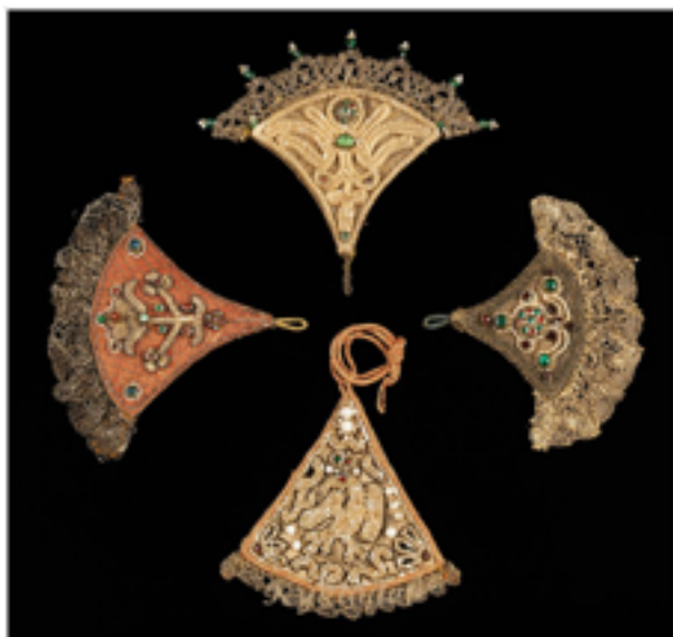
Рисунок 3 – Девичьи украшения для косы «Накосник». Вторая половина XVII в. Москва Figure 3 – Maid's decorations for braids "Nakosnik". The second half of the 17 th century Moscow

С помощью богато орнаментированных полос ткани, прикрепляемых к поясу, и накосников (рисунок 3), вплетаемых в косы, создавалось не только пышное украшение, но и дополнительная обереговая защита со стороны спины. Зашифрованные символы и знаки наделяли узор костюма и аксессуара магической силой. Со временем рисунки потеряли «колдовскую силу», став объектом для изучения и расшифровки заложенных смыслов.