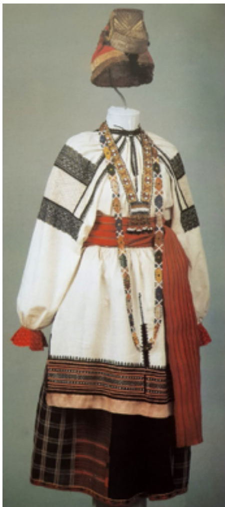
Рисунок 1 – Праздничный костюм молодой женщины первых лет замужества. Воронежская губерния

Одежды Орловской, Курской, Воронежской, Рязанской, Тамбовской, Тульской, Калужской губерний (рисунок 1) относятся к древнему южнорусскому комплексу, сложившемуся в результате контакта с соседними регионами и народностями, такими, как украинцы, белорусы, мордва и др. Простые и лаконичные формы одежды соответствовали первозданному образу жизни людей данного региона, занимающихся ведением натурального хозяйства. Яркая домотканая рубаха девушки отличалась обилием красного цвета. Разнообразные по типу и форме рубахи украшались ткаными и вышитыми узорами, аппликациями из полос и лент. Женщинам старшего возраста полагалась рубаха белого цвета. Перехваченная поясом и надетая поверх поневы, она представляла типичную повседневную одежду для замужних женщин.