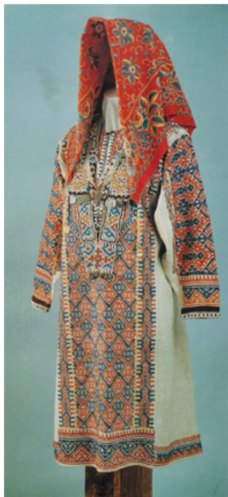
Рисунок 2 – Праздничный женский костюм. Тобольская губерния. Ханты

Вследствие географической расположенности России, северорусский комплекс распространился от Поволжья до Сибири, захватив частично запад и юг. В данных регионах уже было развито промышленное изготовление тканей, позволяющее создавать более сложные одежды (рисунок 2). «Разнообразные