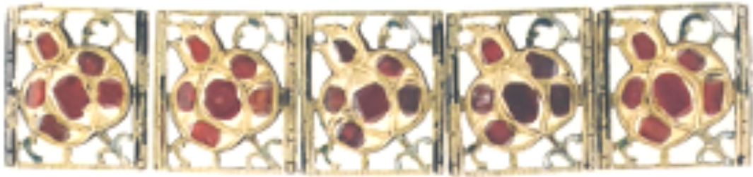
Рисунок 5 – Кружево. Золото, эмаль, рубины. Вторая половина XVII в. Москва Figure 5 – Lace. Gold, enamel, rubies. The second half of the 17 th century. Moscow

Еще один вид украшения второй половины XVII в. — кружево (рисунок 5). Сверкающие ажурные полосы состояли из небольших золотых и серебряных прямоугольных, закрепляющихся на вороте, рукавах и подоле пластинок-запон с эмалью и драгоценными камнями.