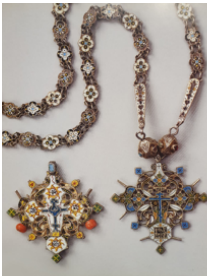
Рисунок 8 – Крест-нательник. Серебро, эмаль, кораллы. Вторая половина XVII в. Сольвычегодск Figure 8 – Cross-natelnik. Silver, enamel, coral. The second half of the 17 th century. Solvychevodsk

Широкое применение получили в России XVI–XVII вв. золотые и серебряные цепи (рисунок 8). Можно наблюдать прирожденное умение древнерусских мастеров находить новые узоры, формы украшений — часто очень остроумные и всегда свободные по легкости развития, в таких, казалось бы, не заслуживающих особого внимания и не дающих большого простора творчеству мелочах, как форма звеньев цепи. Мастера самовыражались в искусстве поиска формы звеньев, способах их скрепления и декорирования орнаментами, чеканкой, гравировкой, эмалью, самоцветами. «Плоские ленты цепей со звеньями различной формы носили женщины поверх одежды, с крестом на груди, который иногда отливали настолько усложненной формы, что он представлял собой декоративное украшение. Особенно красивы цепи Русского Севера XVII в. из небольших звеньев в форме плоских четырехлепестковых цветков, покрытых белой, черной и зеленой эмалью: иногда на белой эмали черные или черные с желтыми точки, а на черные эмали — желтые точки: в центре цветков-розеток голубые кружки. Цепи закончены продолговатыми литыми пластинками со стилизованным цветочным орнаментом на фоне белой эмали» [9].