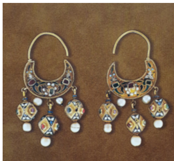
Рисунок 7 – Серьги. Золото, эмаль, рубины, изумруды, жемчуг. XVII в. Москва Figure 7 – Earrings. Gold, enamel, rubies, emeralds, pearls. The 17 century. Moscow

Серьги в форме полумесяца (рисунок 7) с гранеными шариками в виде подвесок были характерны для московских мастеров. В покрывающий серьги сканной орнамент, расцвеченный белой, зеленой и черной эмалью, местами вкраплялась зернь.