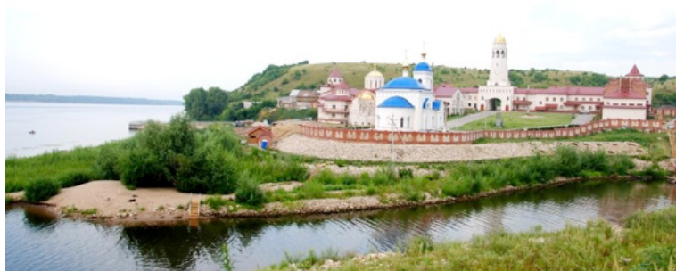
Рисунок 3 – Свято-Богородичный Казанский мужской монастырь в селе Винновка

Архитектурный комплекс монастыря, расположенный на берегу реки и окруженный каменной стеной, имеет вид традиционной крепостной архитектуры XVIII в., когда монастыри являли собой не только культовые объекты, но и продолжали оставаться важными оборонительными узлами и возводились повсеместно на всей территории России. Образы и формы бойниц и их амбразур проявились в решении рядов узких окон всех сооружений комплекса. В архитектуре комплекса монастыря проявляются несколько стилей, однако доминирующим в архитектуре самого храма можно считать европейское и московское барокко. Этот стиль в архитектурном комплексе монастыря проявляется в элементах фасада храма, звонницы колокольни и линиях кровли на ней, арке над входом в колокольню, архитектурных решениях боковых стен и выходов из центрального купольного пространства.